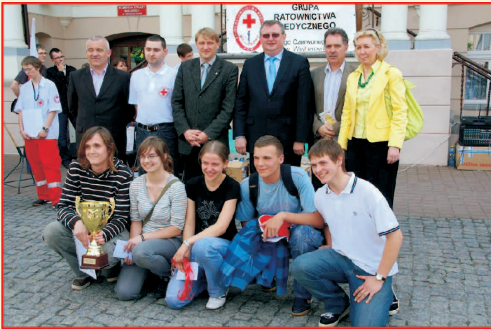
Drużyna I LO im. Króla Jana III Sobieskiego