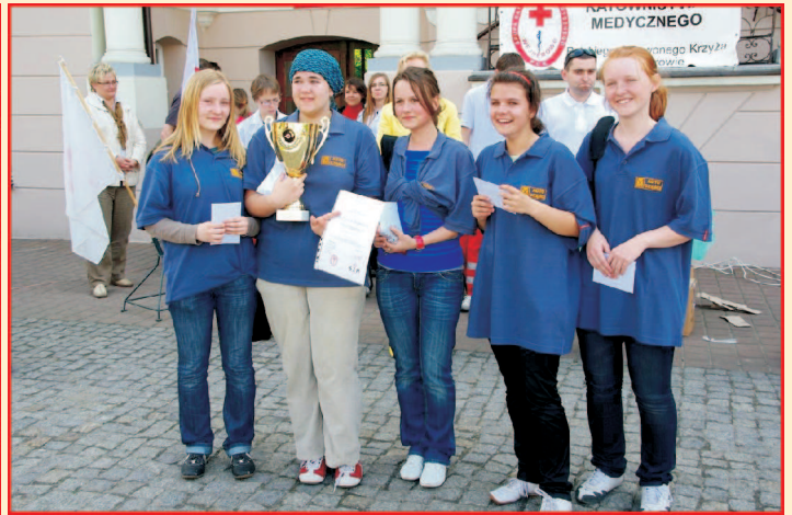
Drużyna Gimnazjum z Bolszewa