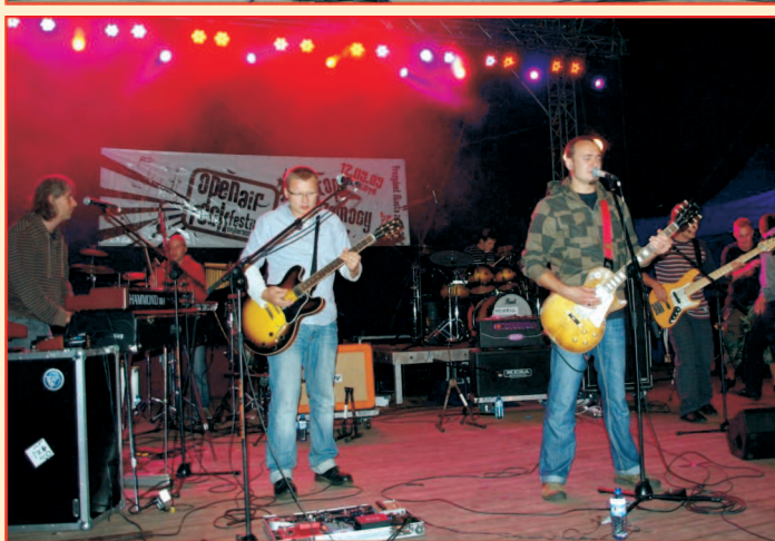
Gwiazda Wieczoru: zespół Lao Che