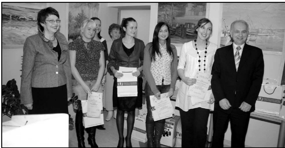
1 nagroda w kategorii dorosłych

Informujemy wszystkich Czytelników, że wszystkie nagrodzone prace w konkursie „Powiew Weny 2009” i wybrane prace pozostałych autorów będzie można przeczytać w tomiku wydanym przez Powiatową i Miejską Bibliotekę Publiczną w Wejherowie oraz na stronie internetowej: www.zobaczwejherowo.pl