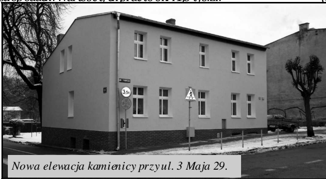
Nowa elewacja kamienicy przy ul. 3 Maja 29.

W budynku przy ul. Bukowej 10 prace podzielone zostały na dwa etapy, z czego pierwszy etap dotyczący ocieplenia został zakończony, w drugim etapie wykonane zostaną prace izolacyjne i prace towarzyszące. Prace kosztowały ponad 82 tys. złotych. Natomiast w budynku przy ul. 12 Marca 234 A usunięto uszkodzone fragmenty tynku, wymieniono część okien, wymieniono i uzupełniono izolację, wzmocniono pęknięcia muru, oczyszczono i zaimpregnowano elewację oraz ocieplono stropodach. Wartość tych prac to ok. 41,5 tys. zł. (ir)