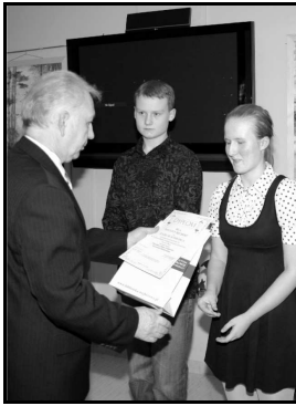
3 nagroda w kategorii dorosłych