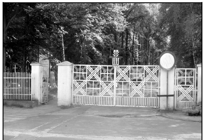
Przy wejherowskim cmentarzu przy ul. Roszczyńskiego powstanie nowy parking.

Nie wywoła to jednak żadnych negatywnych skutków, bo samochody, którymi i tak przyjeżdżają żałobnicy na ceremonię pogrzebową na cmentarzu będą stały godzinę-dwie dłu-