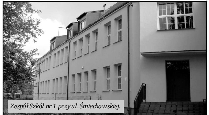
Zespół Szkół nr 1 przy ul. Śmiechowskiej.

- Zaangażowanie w ten projekt pokazuje, że oświata, edukacja wejherowskich dzieci i młodzieży jest dla nas bardzo ważna. Jesteśmy skuteczni w pozyskiwaniu środków unijnych na różne inwestycje, a to świadczy o tym, że działamy profesjonalnie. Pomimo tego, że opozycja utrudnia mi działania, to robię co mogę, aby sprawy miasta szły w dobrym kierunku, korzystnie dla mieszkańców - podsumowuje prezydent Wejherowa Krzysztof Hildebrandt.