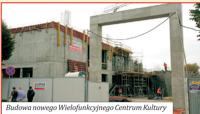
Budowa nowego Wielofunkcyjnego Centrum Kultury