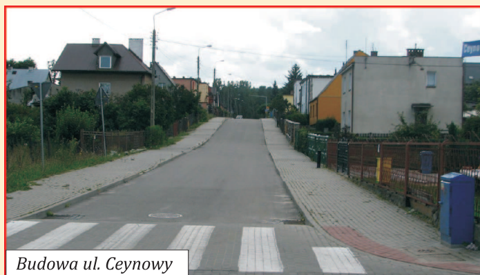
Budowa ul. Ceynowy