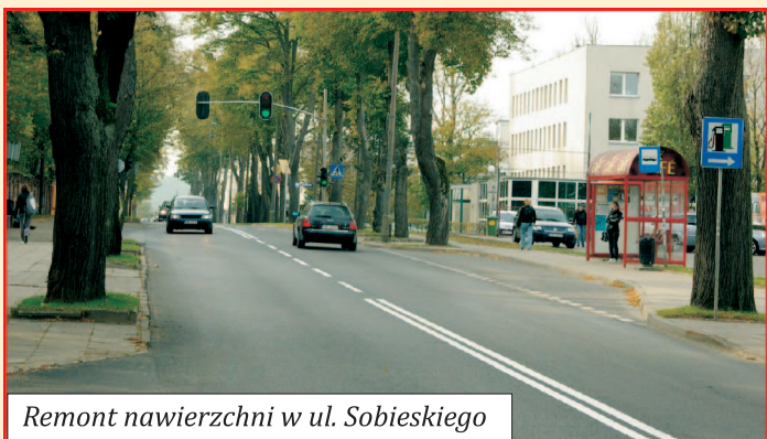
Remont nawierzchni w ul. Sobieskiego