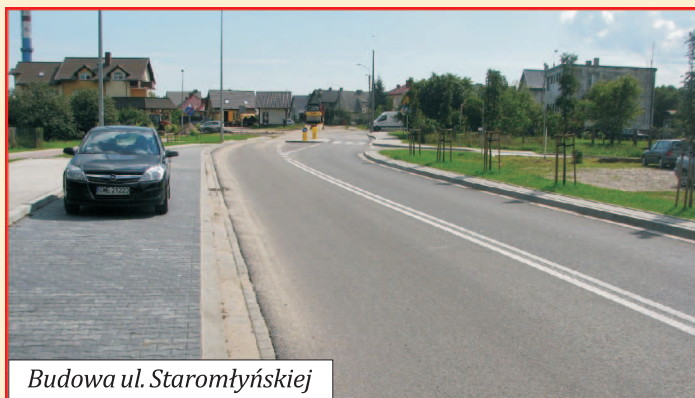
Budowa ul. Staromłyńskiej