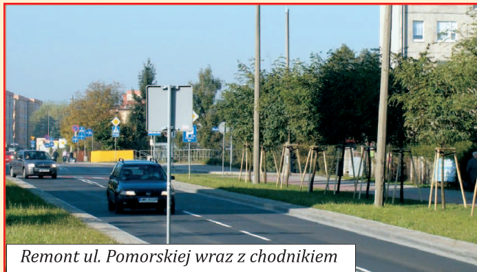
Remont ul. Pomorskiej wraz z chodnikiem