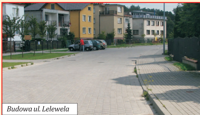
Budowa ul. Lelewela