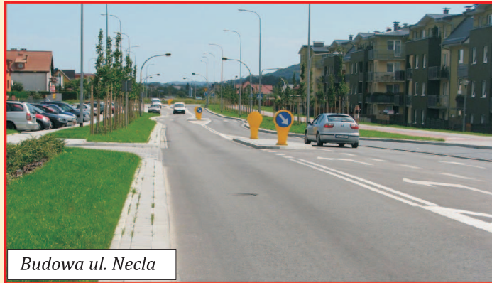
Budowa ul. Necla