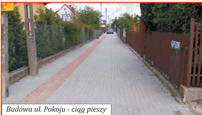
Budowa ul. Pokoju - ciąg pieszy