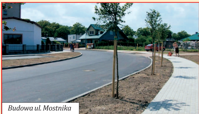
Budowa ul. Mostnika