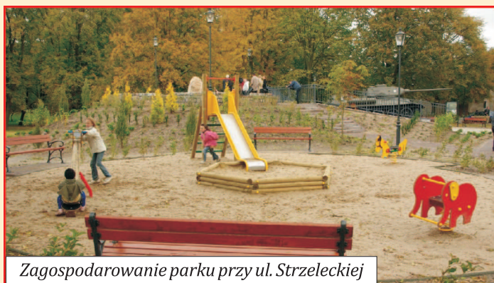
Zagospodarowanie parku przy ul. Strzeleckiej