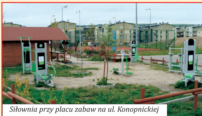
Siłownia przy placu zabaw na ul. Konopnickiej