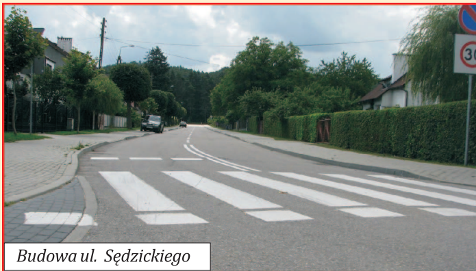
Budowa ul. Sędzickiego