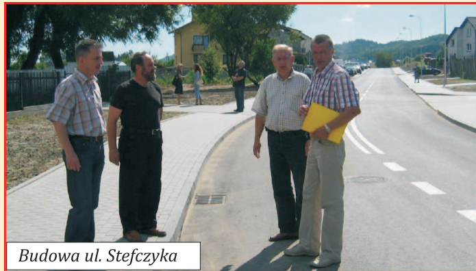
Budowa ul. Stefczyka