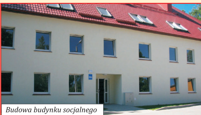
Budowa budynku socjalnego