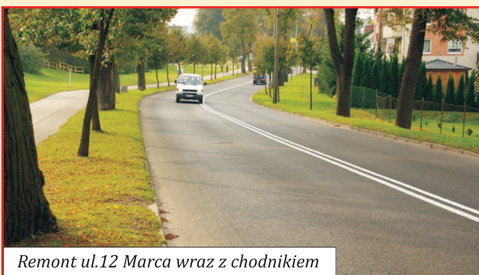
Remont ul. 12 Marca wraz z chodnikiem