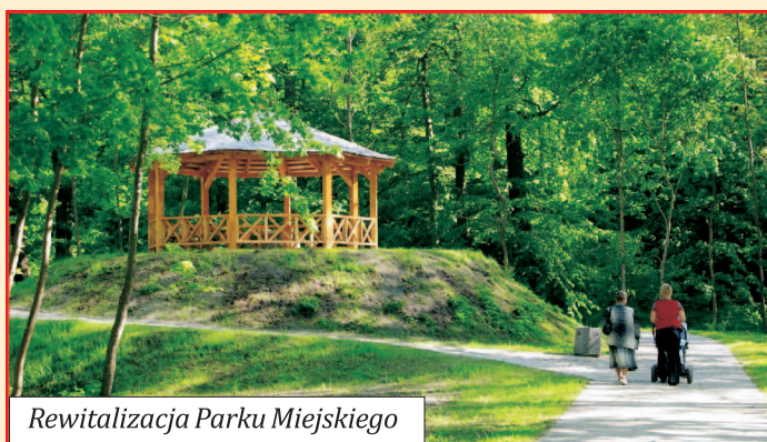
Rewitalizacja Parku Miejskiego