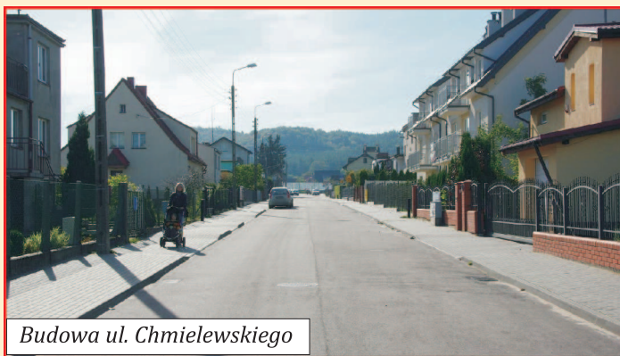
Budowa ul. Chmielewskiego