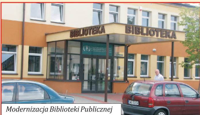
Modernizacja Biblioteki Publicznej