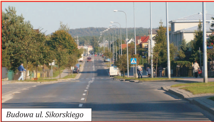
Budowa ul. Sikorskiego