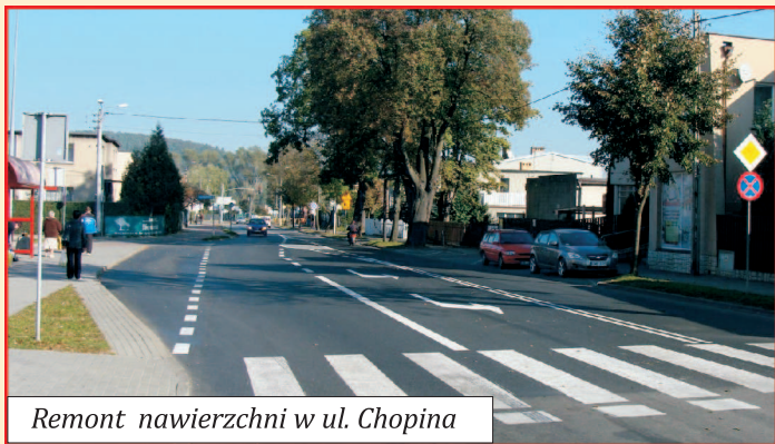
Remont nawierzchni w ul. Chopina