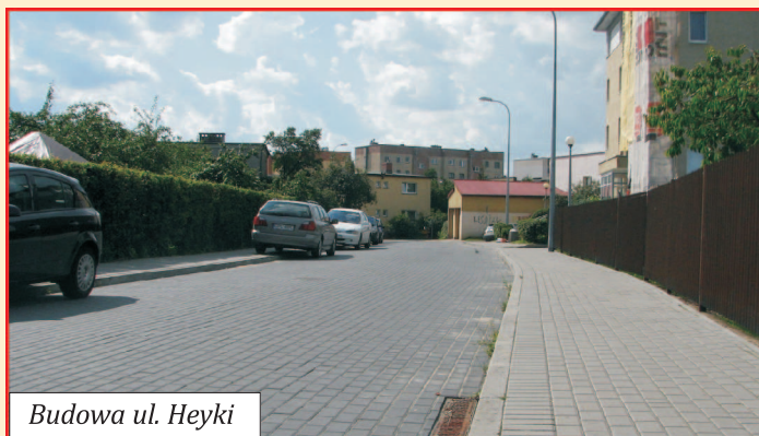
Budowa ul. Heyki