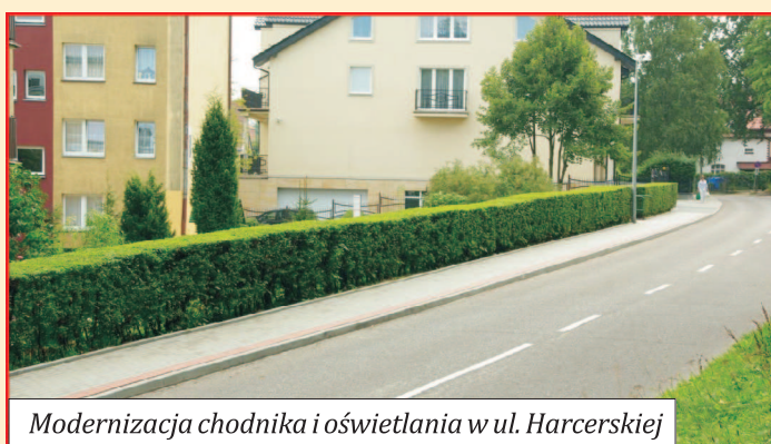
Modernizacja chodnika i oświetlenia w ul. Harcerskiej