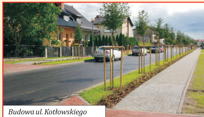
Budowa ul. Kotłowskiego