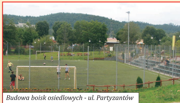
Budowa boisk osiedlowych - ul. Partyzantów