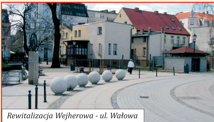
Rewitalizacja Wejherowa - ul. Wałowa

W mijającej kadencji 2006-2010 miasto wydało ponad 100 mln złotych na inwestycje i remonty w Wejherowie. Dla porównania roczny budżet miasta wynosi 130-135 mln zł, zaś w kadencji 2002-2006 na inwestycje wydano 52 mln zł. Miasto zdobyło ponad 50 mln zł różnych dotacji unijnych. Inwestycje realizowane za te pieniądze służą mieszkańcom Wejherowa.