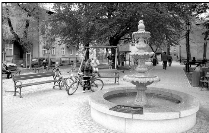
Przebudowa ul. Północnej to element Rewitalizacji Śródmieścia Wejherowa.

Najważniejsze zadania inwestycyjno-remontowe w minionej kadencji przedstawiamy również w fotoreportażu na str. 7-10.