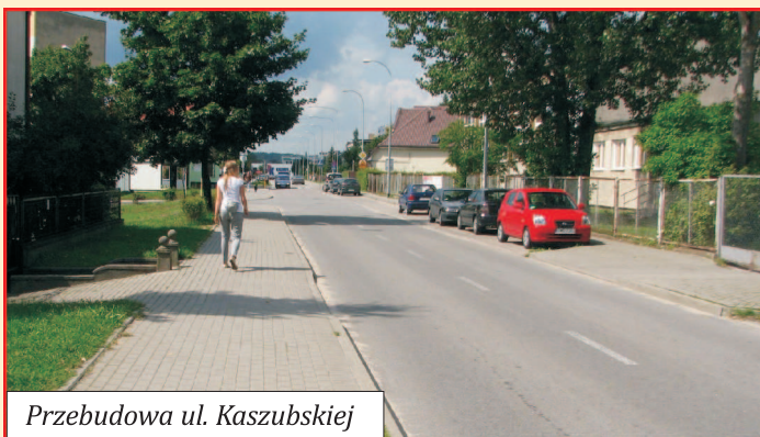
Przebudowa ul. Kaszubskiej