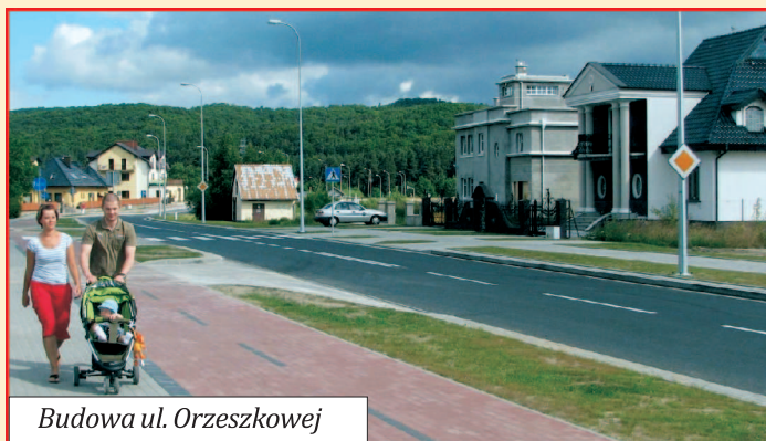
Budowa ul. Orzeszkowej