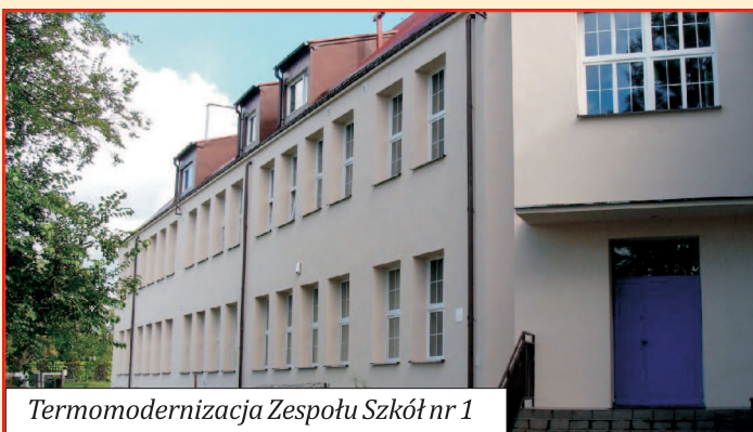
Termomodernizacja Zespołu Szkół nr 1