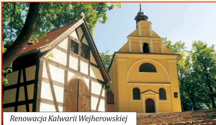
Renowacja Kalwarii Wejherowskiej