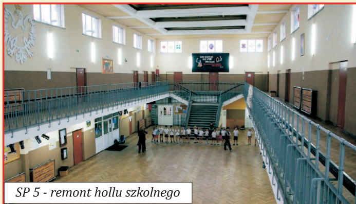
SP 5 - remont hollu szkolnego