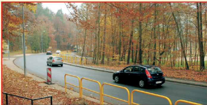
Przebudowa drogi wojewódzkiej nr 218 (udział finansowy)