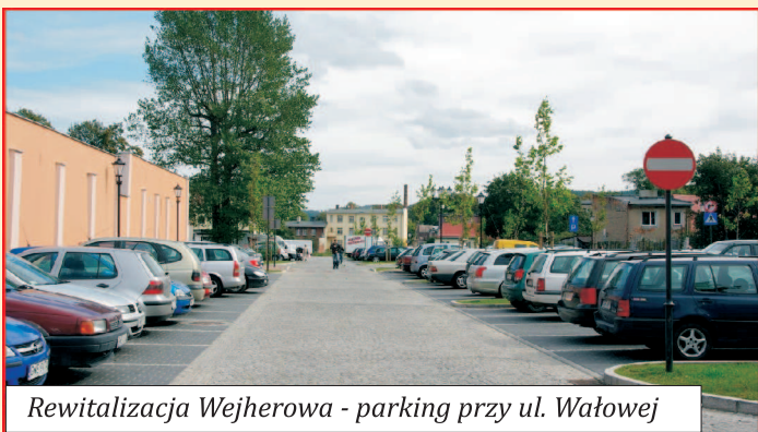
Rewitalizacja Wejherowa - parking przy ul. Wałowej