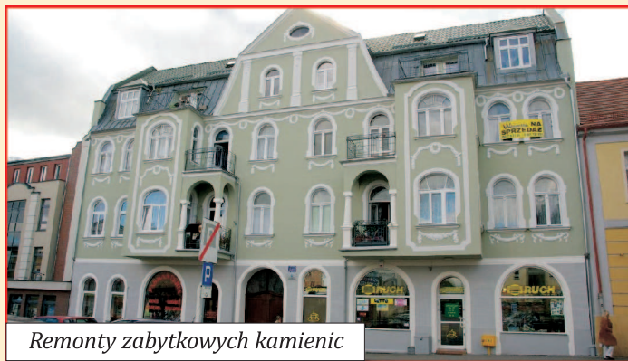
Remonty zabytkowych kamienic