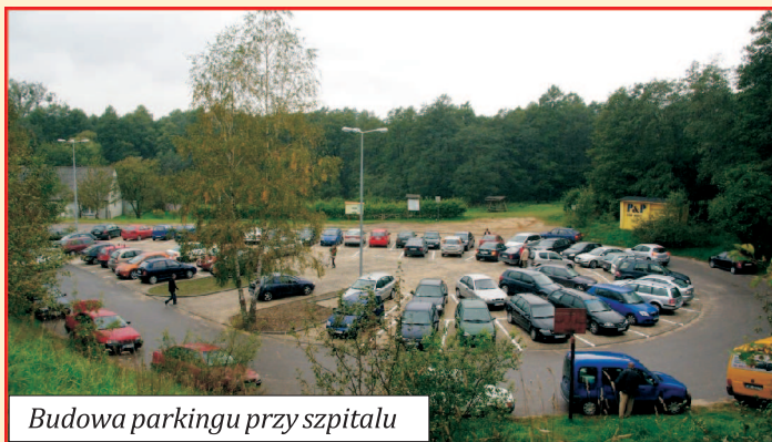
Budowa parkingu przy szpitalu