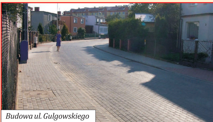
Budowa ul. Gulgowskiego