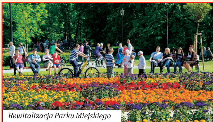
Rewitalizacja Parku Miejskiego