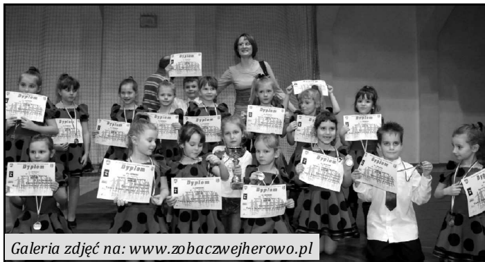
Galeria zdjęć na: www.zobaczwejherowo.pl

Ogromnym sukcesem dziecięcych i młodzieżowych grup tanecznych z Wejherowa zakończył się V Ogólnopolski Festiwal Tańca Nowoczesnego w Łęborku. Formacje „Enigma”, „Explozja” i „Carmen” z klubu tanecznego „Świat Tańca” były bezkonkurencyjne w swoich kategoriach.