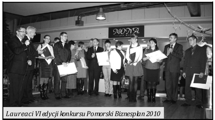
Laureaci VI edycji konkursu Pomorski Biznesplan 2010