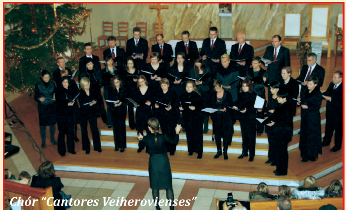
Chór "Cantores Veiherovienses"