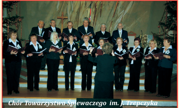
Chór Towarzystwa Śpiewaczego im. J. Trepczyka