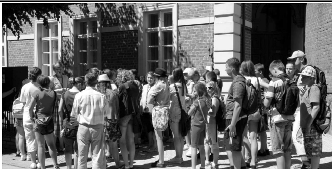
Wycieczki z przewodnikiem cieszą się ogromnym zainteresowaniem

Turyści i wszystkie chętne osoby chcące poznać najważniejsze zabytki miasta i posłuchać opowieści o historii naszego grodu mogą codziennie w okresie od 4 lipca do 26 sierpnia skorzystać z oferty zwiedzania miasta Zbiórka o godz. 11.00 przed furką klasztorną Klasztoru oo. Franciszkanów przy ul. Reformatorów 19. Udział grup zorganizowanych należy poprzedzić rezerwacją, gdyż liczba miejsc jest ograniczona. Rezerwacji można dokonać pod nr tel. 58 677 70 58. Wycieczki oprowadzane są przede wszystkim po Kalwarii Wejherowskiej, kościele klasztornym, po ratuszu i Parku Miejskim.