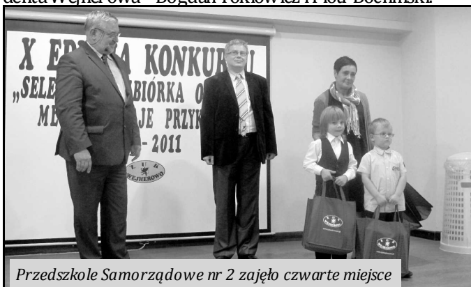
Przedszkole Samorządowe nr 2 zajęło czwarte miejsce