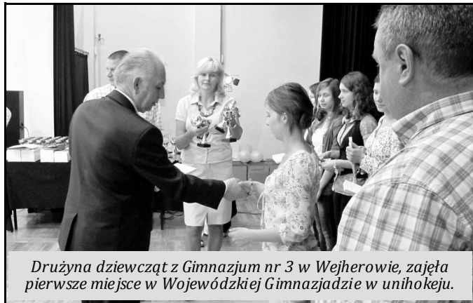
Drużyna dziewcząt z Gimnazjum nr 3 w Wejherowie, zajęła pierwsze miejsce w Wojewódzkiej Gimnazjadzie w unihokeju.