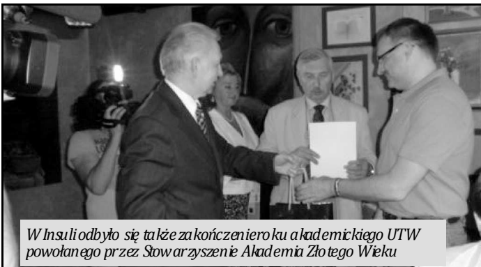
W Insuli odbyło się także zakończenie roku akademickiego UTW powołanego przez Stowarzyszenie Akademia Złotego Wieku