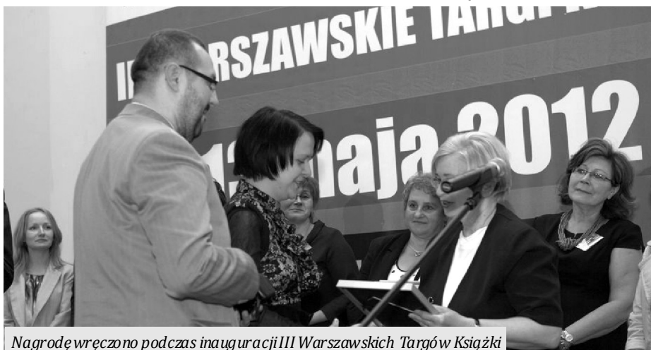
Nagrodę wręczono podczas inauguracji III Warszawskich Targów Książki

Wejherowska biblioteka zajęła trzecie miejsce w ogólnopolskim konkursie "Mistrz Promocji Czytelnictwa" organizowanym przez Stowarzyszenie Bibliotekarzy Polskich we współpracy z Instytutem Książki.