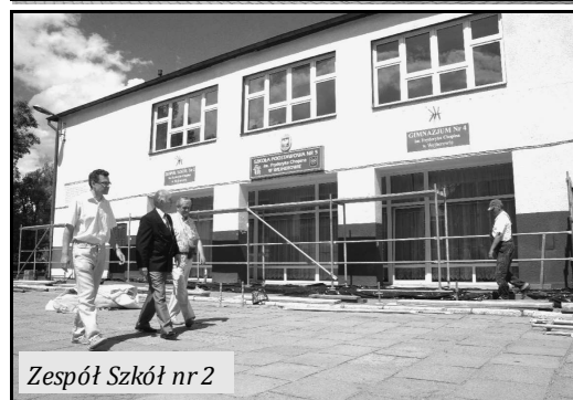
Zespół Szkół nr 2