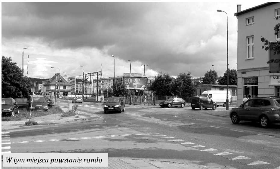
W tym miejscu powstanie rondo

Dzięki długim staraniom prezydenta Wejherowa Krzysztofa Hildebrandta jeszcze w tym roku rozpoczną się prace związane z przebudową drogi wojewódzkiej nr 218 w obrębie skrzyżowania ulic: św. Jana - Sienkiewicza - 10 Lutego przed przejazdem kolejowym.