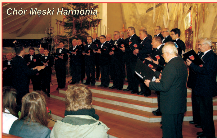
Chór Męski Harmonia