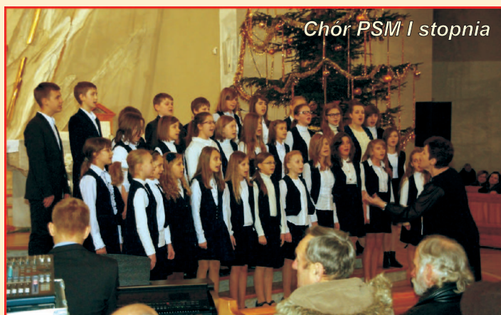
Chór PSM I stopnia