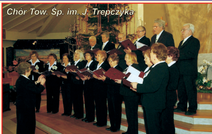
Chór Tow. Śp. im. J. Trepczyka