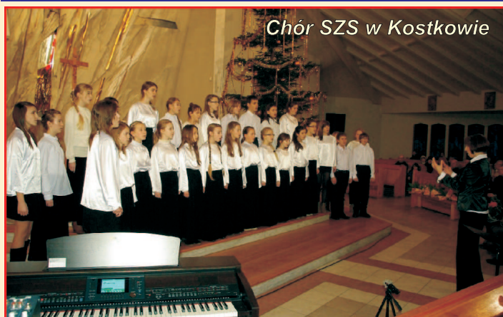
Chór SZS w Kostkowie