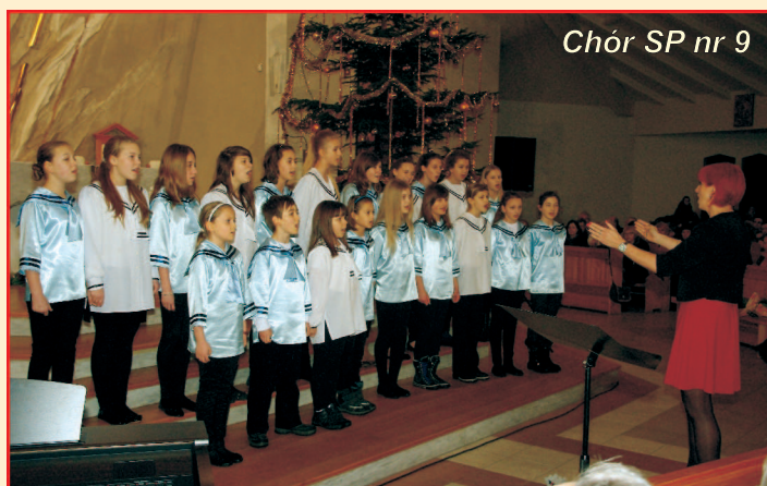
Chór SP nr 9