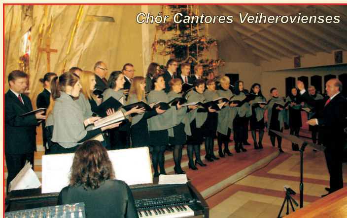
Chór Cantores Veiherovienses