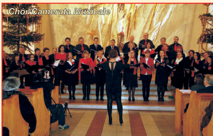
Chór Camerata Musicale