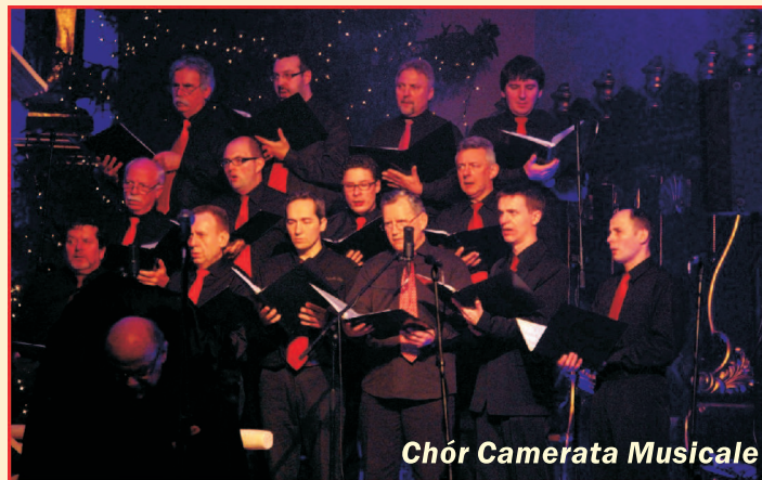
Chór Camerata Musicale