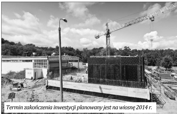
Termin zakończenia inwestycji planowany jest na wiosnę 2014 r.

Budowa trwa, a zatem mogą wystąpić chwilowe zakłócenia w systemie dystrybucji wody. W okresie budowy mogą wystąpić niewielkie pogorszenia parametrów wody w sieci. Woda spełniać będzie jednak parametry ustalone przez służbę sanitarną i nadal będzie zdatna do spożycia. Całkowity koszt tej inwestycji wyniesie ok. 16 mln zł. Zadanie to finansowane jest wyłącznie ze środków własnych PEWIK GDYNIA. Współwłaścicielem spółki jest miasto Wejherowo.