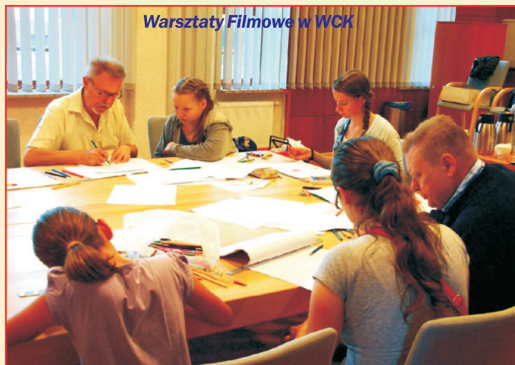
Warsztaty Filmowe w WCK