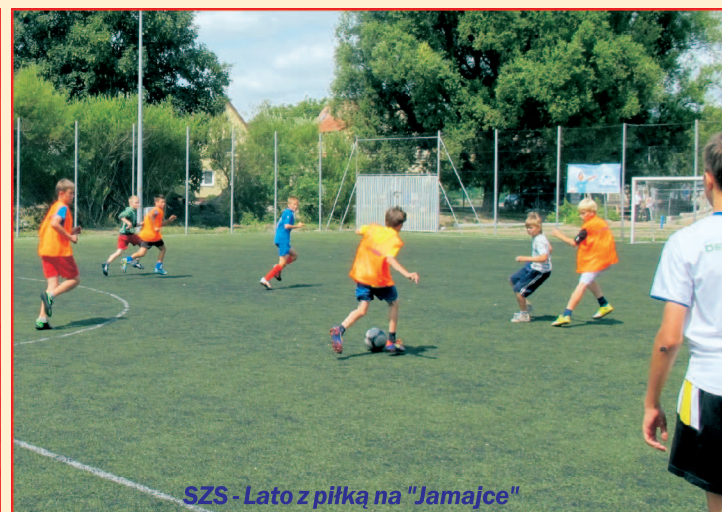
SZS - Lato z piłką na "Jamajce"