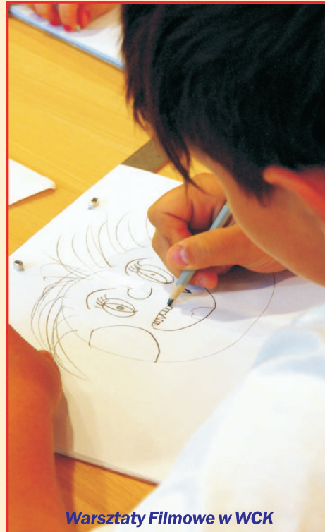
Warsztaty Filmowe w WCK

Letni wypoczynek ze środków budżetowych miasta zorganizowali: „Harcerską Akcją Lato 2013”- ZHR i ZHP, półkolonie - Zgromadzenie Sióstr Albertynek, Caritas, Akcja Katolicka pw. św. Leona, KS Tytani, Stowarzyszenie Przyjaciół Rodziny, Powiatowa i Miejska Biblioteka Publiczna, półkolonie sportowe - Karate Klub, Wejherowskie Towarzystwo Tenisowe i Wejherowska Akademia Piłki Nożnej „Błękitni”.