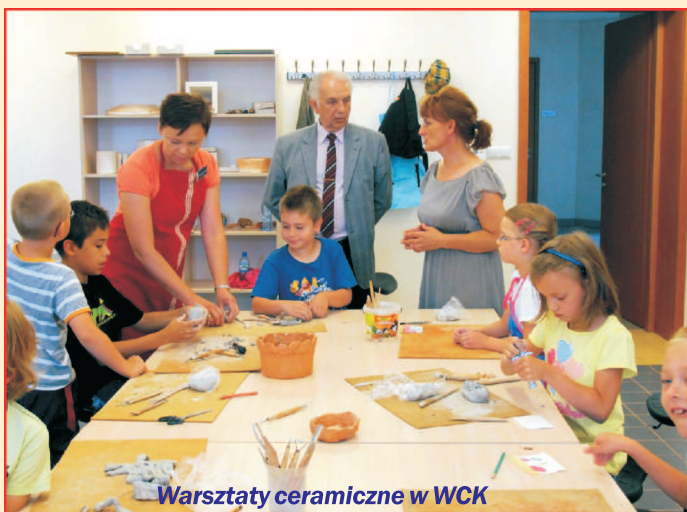
Warsztaty ceramiczne w WCK