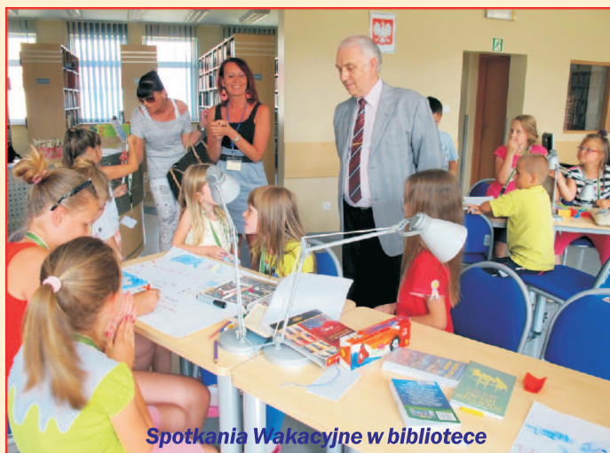
Spotkania Wakacyjne w bibliotece

Program letnich zajęć został przygotowany w Wejherowie z myślą o dzieciach i młodzieży, którzy chcą w ciekawy, aktywny i pełen wrażeń sposób spędzić czas wakacji. Ceramiczne dzieła, projektowanie strojów, tworzenie filmu animowanego, albo rzeźbienie w glinie lub drewnie – to m.in. zajęcia przygotowane przez Wejherowskie Centrum Kultury. Szereg atrakcji przygotowała także Powiatowa i Miejska Biblioteka Publiczna i Szkolny Związek Sportowy.