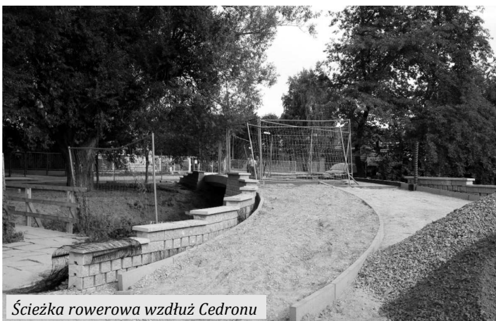
Ścieżka rowerowa wzdłuż Cedronu

- Myślę, że ogólnie wszystkie prace przebiegają zgodnie z planem i zacierają ku fazie finalnej. Trwa również budowa ciągu pieszo-rowerowego pomiędzy ul. Partyzantów a ul. Panek wzdłuż Cedronu, na którym budowany jest również nowy mostek – dodaje sekretarz miasta.