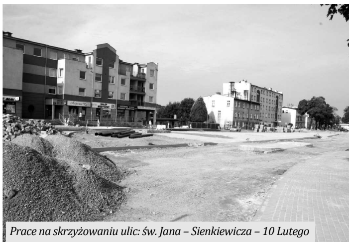
Prace na skrzyżowaniu ulic: św. Jana – Sienkiewicza – 10 Lutego

Trwa przebudowa skrzyżowania ulic Św. Jana – Sienkiewicza – 10 Lutego na drodze wojewódzkiej przed przejazdem kolejowym. W związku z przebudową nastąpią utrudnienia w ruchu. Od 2 września skrzyżowanie oraz przejazd kolejowy będzie zamknięty. O zmianach będziemy informować na bieżąco na: www.wejherowo.pl