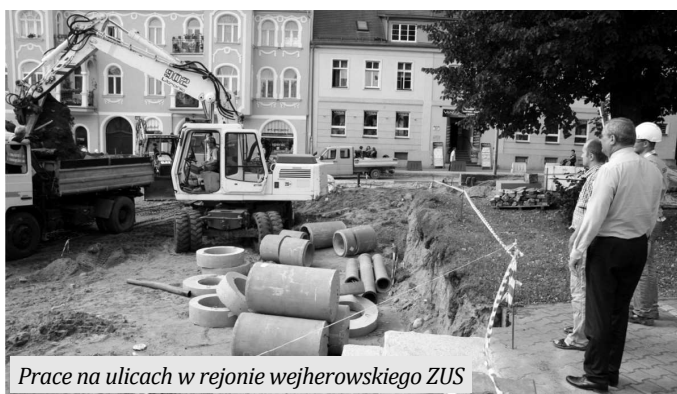
Prace na ulicach w rejonie wejherowskiego ZUS

Zakończono budowę ul. Stanisławy Panek na odcinku od ul. Partyzantów do Kauflandu. Trwa budowa ul. Kołowskiego wraz z infrastrukturą (do skrzyżowania z ul. Rogaczewskiego) oraz budowa ulic: Konopnickiej i Morskiej. Trwa przebudowa ul. Śmiechowskiej oraz trzeci etap prac związanych z Rewitalizacją Śródmieścia Wejherowa, który będzie obejmował prace na ulicach w rejonie ZUS-u.