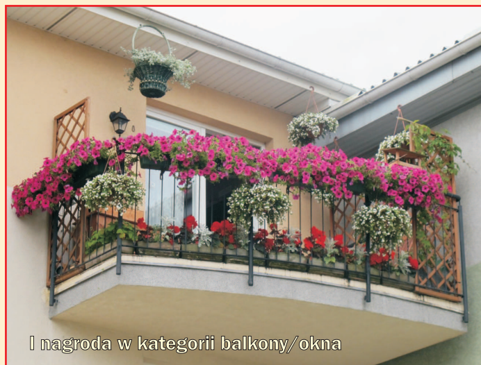
I nagroda w kategorii balkony/okna