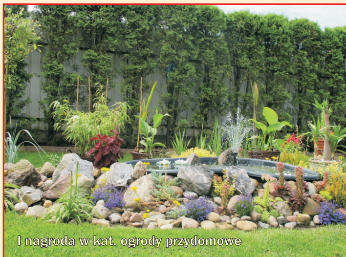
I nagroda w kat. ogrody przydomowe