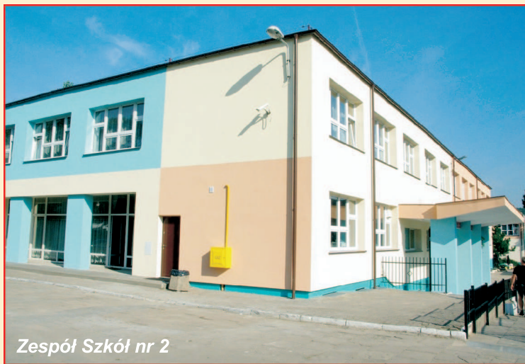
Zespół Szkół nr 2

Roman Pikula – przewodniczący jury konkursu „Modernizacja Roku” poinformował, że województwo pomorskie zebrało w tym roku 4 z 14. laurów spośród ponad 800. obiektów z całego kraju, jakie zgłoszono do tegorocznej rywalizacji. Dodał również, że Konkurs pokazuje, iż nawet w niewielkich miejscowościach można realizować atrakcyjne inwestycje.