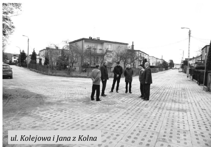
ul. Kolejowa i Jana z Kolna