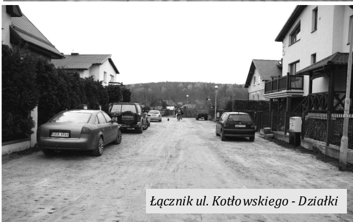
Łącznik ul. Kołłowskiego - Działki