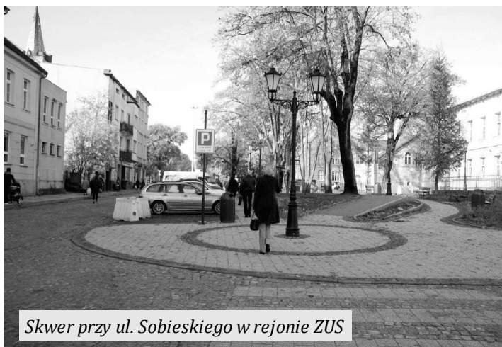
Skwer przy ul. Sobieskiego w rejonie ZUS