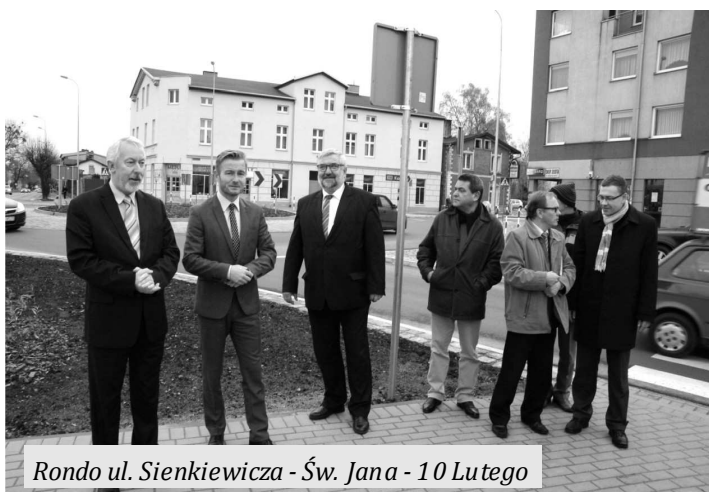
Rondo ul. Sienkiewicza - Św. Jana - 10 Lutego