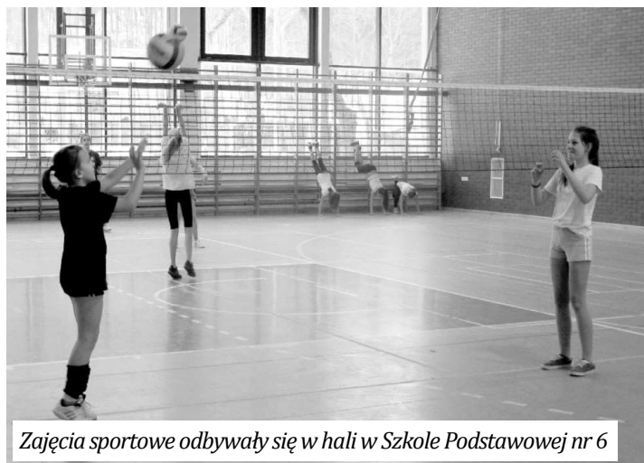
Zajęcia sportowe odbywały się w hali w Szkole Podstawowej nr 6