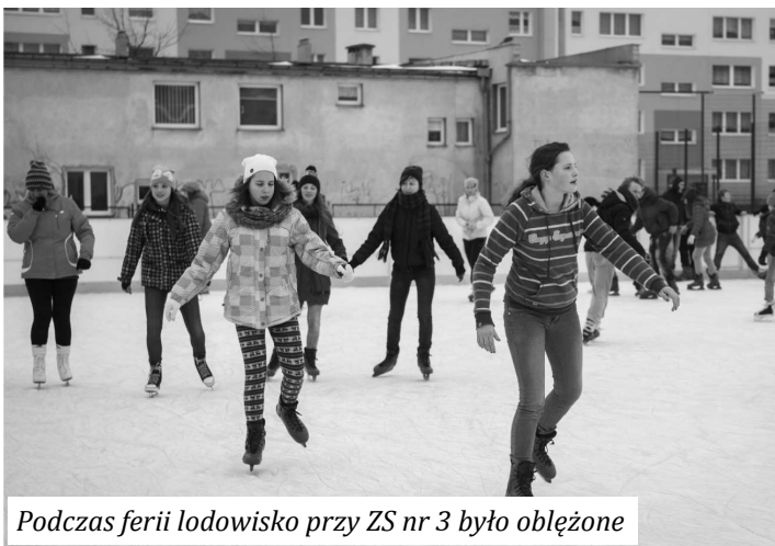
Podczas ferii lodowisko przy ZS nr 3 było obleżone

Ponadto w programie były przedstawienia i tańce. W trakcie ferii w bibliotece odbyły się dwa teatryki dla dzieci - przedstawienie „Tajemnica zaginionych liter” oraz „Bolek i Lolek – Wilk i Zając”.