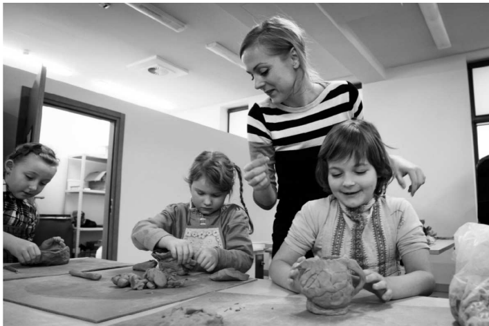
Zajęcia ceramiczne w Wejherowskim Centrum Kultury