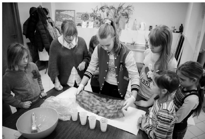
W Wejherowskim Centrum Kultury odbywały się warsztaty batiku (technika malarska polegająca na kolejnym nakładaniu wosku i kąpieli tkaniny w barwniku, który farbuje jedynie miejsca nie zamaskowane warstwą wosku).