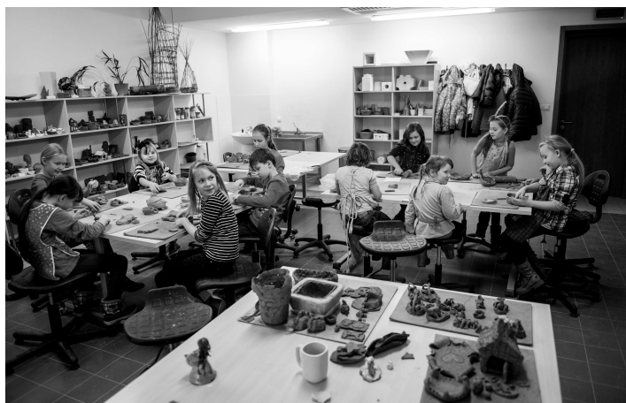
Warsztaty ceramiczne w WCK