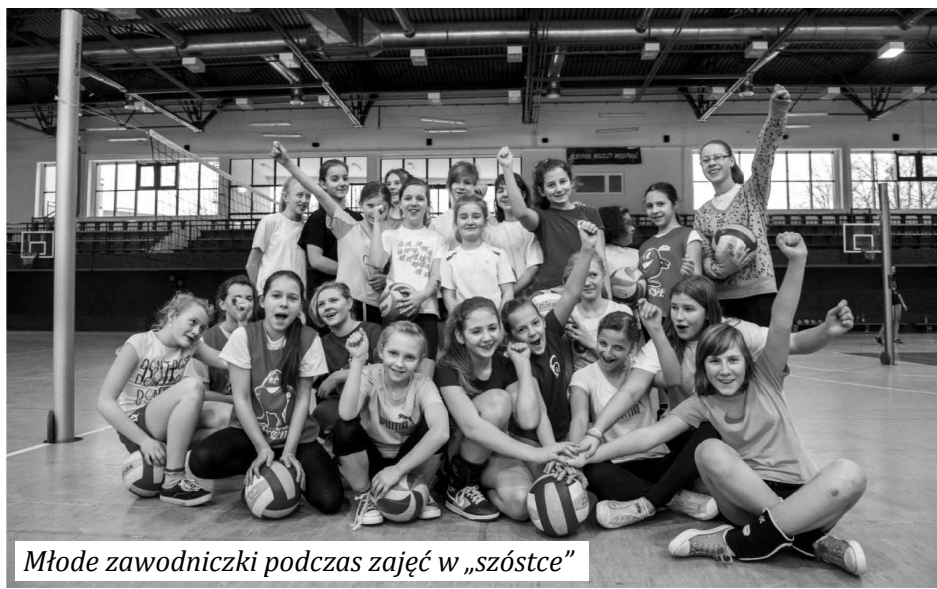
Młode zawodniczki podczas zajęć w „szóstce”