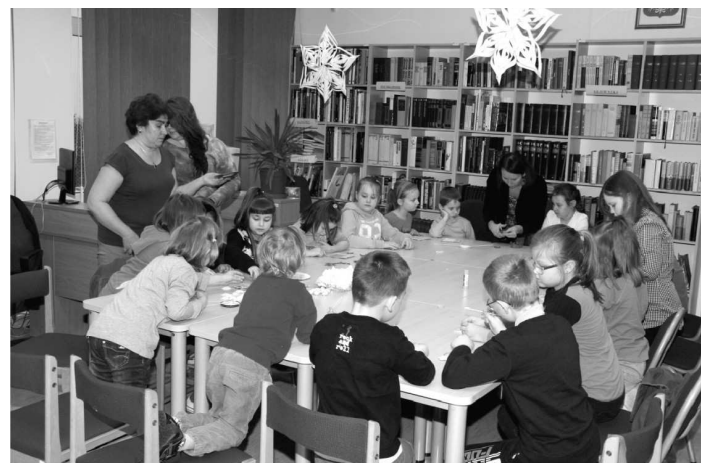
W wejherowskiej bibliotece dzieci poprzez zabawę poznawały fascynujący świat książek