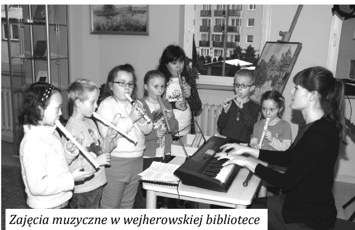
Zajęcia muzyczne w wejherowskiej bibliotece