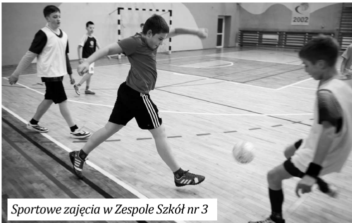
Sportowe zajęcia w Zespole Szkół nr 3

Dzieci i młodzież mogły korzystać z promocyjnych cen na lodowisku i krytej pływalni.