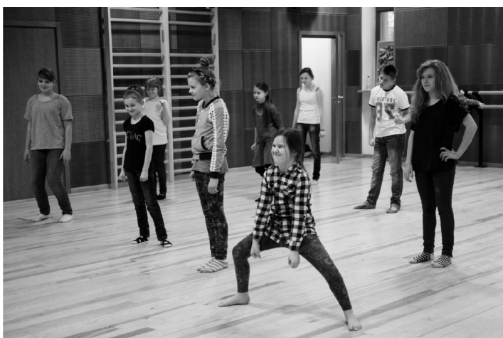
Dla młodzieży Wejherowskie Centrum Kultury przygotowało warsztaty pantomimy