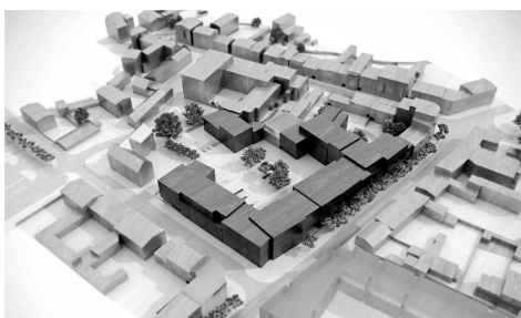
Koncepcja przestrzenno-architektoniczna zagospodarowania Centrum biznesowego w kwartale ulic: 12 Marca, Wniebowstąpienia i Reformatów w Wejherowie

- Przygotowanie porozumienia i koncepcji to efekt trzymiesięcznej pracy. Taka dyskusja nie powinna trwać długo, bo jeżeli jesteśmy przekonani do inwestycji, to powinniśmy szybko ją realizować. Dzisiaj etap przygotowania dokumentacji jest dłuższy, niż sama budowa. Dla mieszkańców Wejherowa ważną rzeczą jest polepszenie dostępu do wymiaru sprawiedliwości, co wiąże się w pierwszej kolejności z zapewnieniem właściwych warunków lokalowych Sądowi Rejonowemu w Wejherowie. Dlatego miasto przekazuje Sądowi nieruchomości, która może być przeznaczona pod budowę nowej siedziby Sądu.