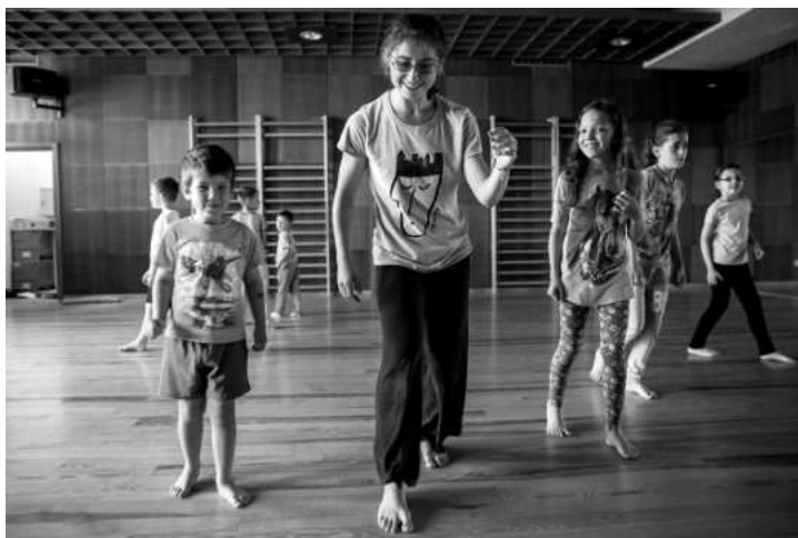
Wejherowskie Centrum Kultury przygotowało ciekawą ofertę zajęć warsztatowych dla dzieci i młodzieży - na zdjęciu warsztaty taneczne