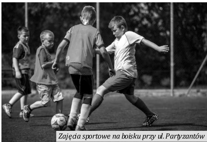
Zajęcia sportowe na boisku przy ul. Partyzantów