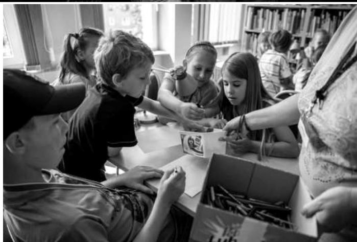
Miejska Biblioteka Publiczna w Wejherowie oferowała zajęcia związane z ekologią, teatrem i muzyką oraz rozrywką