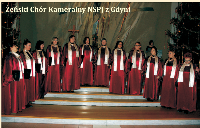
Żeński Chór Kameralny NSPJ z Gdyni