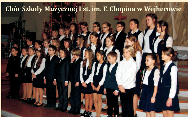
Chór Szkoły Muzycznej I st. im. F. Chopina w Wejherowie

W "Koncercie Kolęd" organizowanym przez Prezydenta Miasta Wejherowa i Proboszcza Parafii NMP Królowej Polski wystąpiły następujące chóry: Młodzieżowy Chór Liceum Ogólnokształcącego im. Króla Jana III Sobieskiego w Wejherowie, Chór Szkoły Muzycznej I. st. im. Fryderyka Chopina w Wejherowie, Żeński Chór Kameralny z Parafii pw. NSPJ w Gdyni, Chór Mieszany "Camerata Musicale" w Wejherowie, Chór Żeński "Gaudeamus" z Gm. Wejherowo, Chór Męski "Harmonia" w Wejherowie, Zespół Wokalny "Art'N'Voices" w Wejherowie i Chór Mieszany "Cantores Veiherovienses" w Wejherowie.