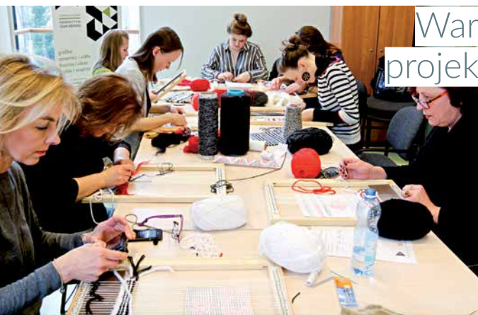
Projekt „Nadbałtycki szlak designu” dofinansowano ze środków Ministra Kultury i Dziedzictwa Narodowego.