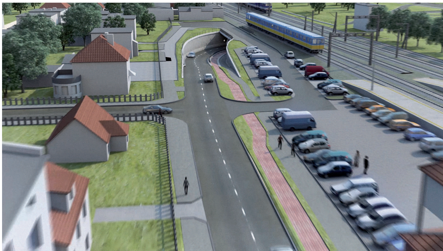
Wiadukt kolejowy (pod torami kolejowymi) w ciągu ulicy Kwiatowej – widok od dworca PKS.