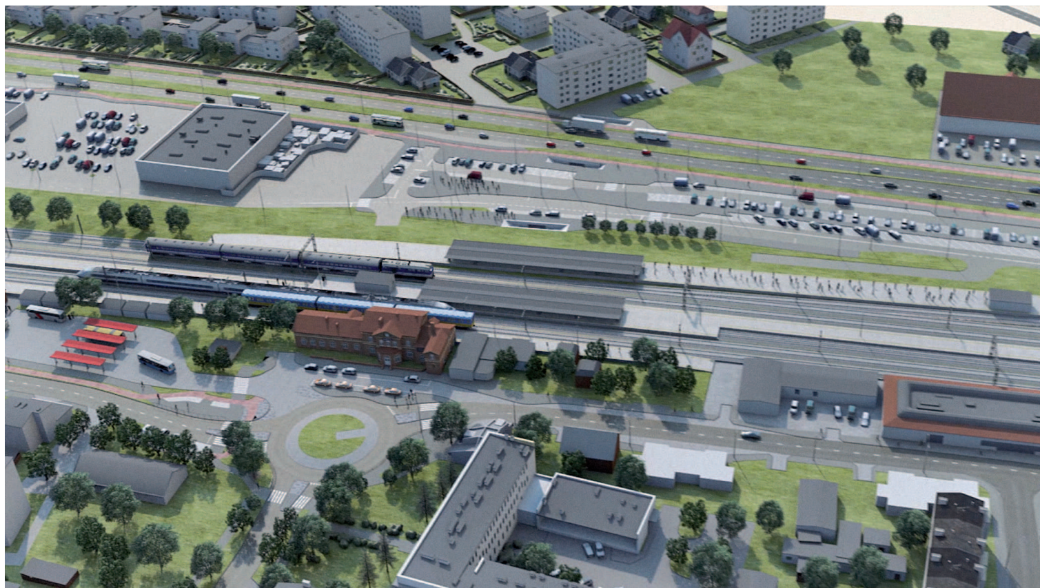
Inwestycja „Węzeł Wejherowo” obejmuje tereny położone pomiędzy ulicami 10 Lutego, Kwiatową i Spacerową, a ulicą I Brygady Pancерnej Wojska Polskiego.