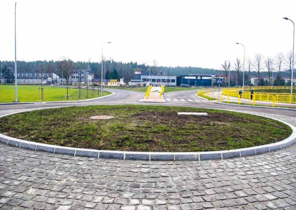
Węzeł Śmiechowo (Zryw) wraz z połączeniem drogi krajowej nr 6