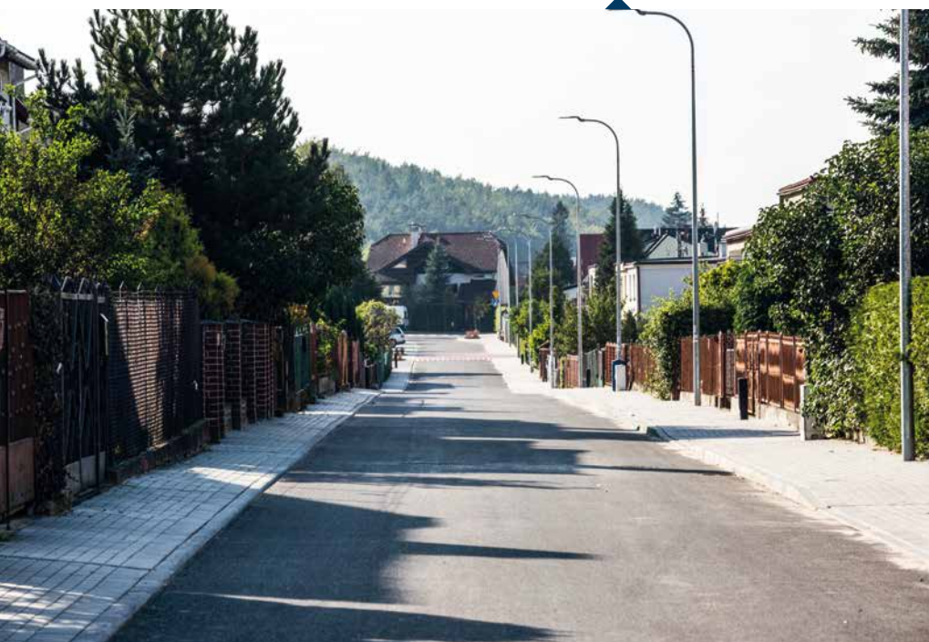
Przebudowa ul. Westerplatte/Paderewskiego