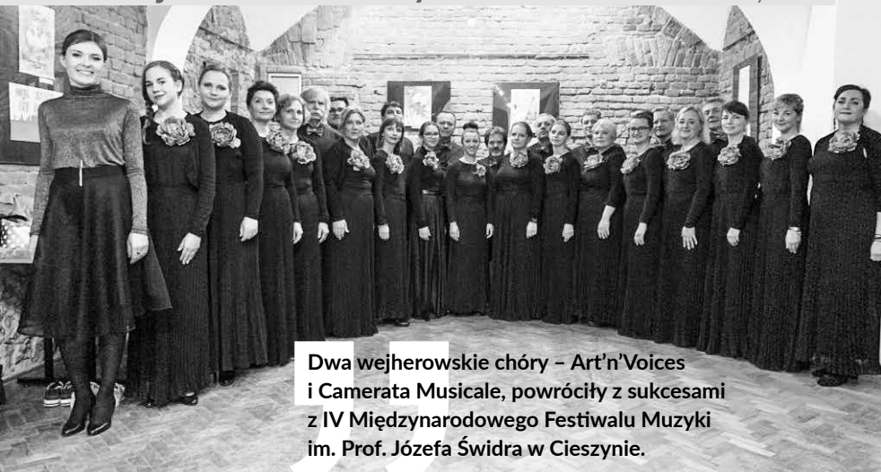
Dwa wejherowskie chóry – Art'n'Voices i Camerata Musicale, powróciły z sukcesami z IV Międzynarodowego Festiwalu Muzyki im. Prof. Józefa Świdra w Cieszynie.