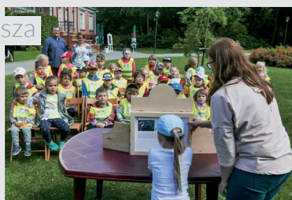
Na zdjęciu: Dzieci z Przedszkola „Urwis”

Letnia biblioteka zaprasza najmłodszych na pokazy teatrzyku Kamishibai, które podczas wakacji odbywają w dwa pierwsze piątki miesiąca o godz. 14 przy tarasie od strony fontanny.