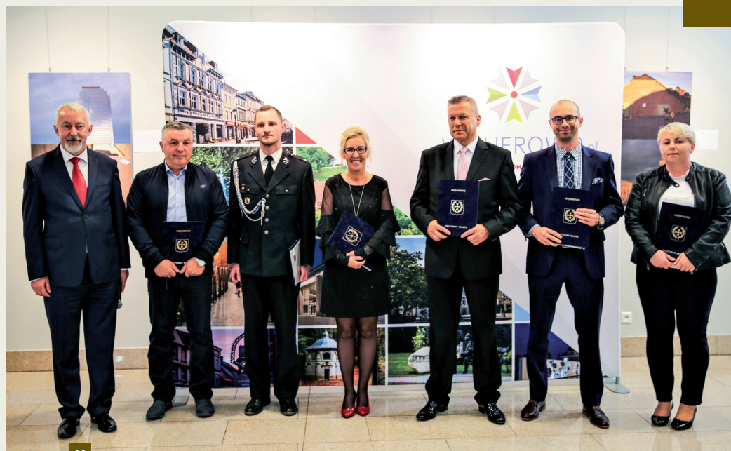
Autorzy zwycięskich projektów inwestycyjnych