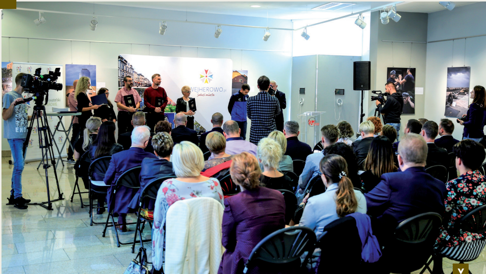
W głosowaniu wzięło udział 8 151 wejherowian, a frekwencja wyniosła 21,64 proc. i była najwyższa w całej metropolii nad Zatoką Gdańską.