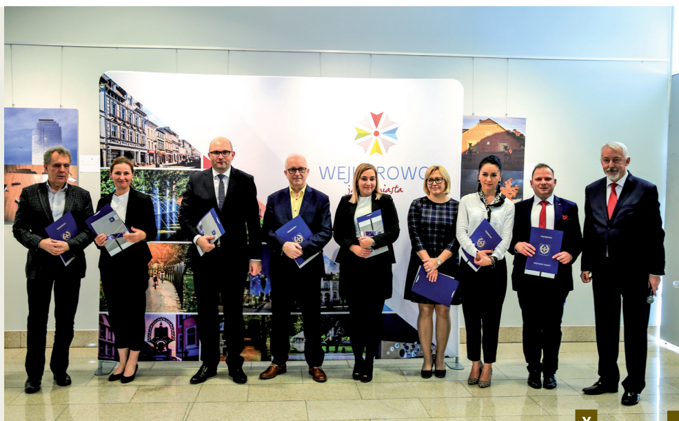
Čłonkowie komisji ds. Budżetu Obywatelskiego