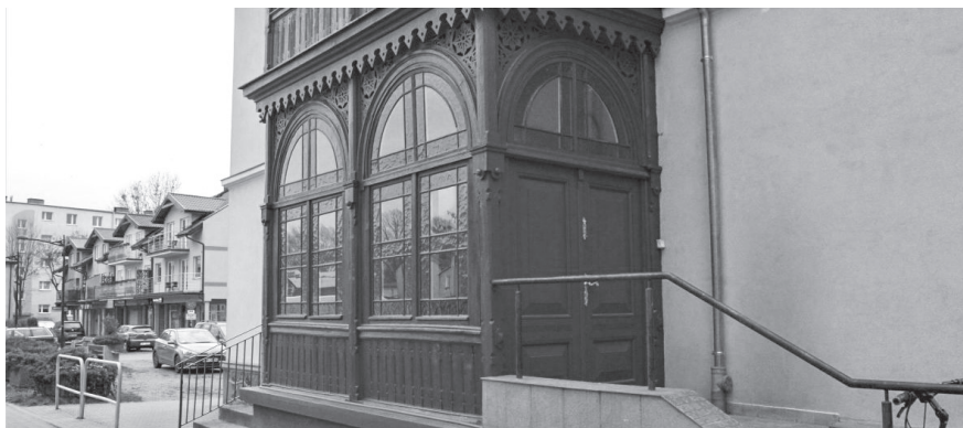
W budynku przy ul. Dworcowej 3 wyremontowano zabytkową, drewnianą werandę

W najbliższym czasie prowadzone będą prace konserwatorsko-modernizacyjne w budynkach: przy ulicy Sobieskiego 328, Sobieskiego 328C oraz u zbiegu Puckiej 1 i Wałowej 23 w Wejherowie. Przy budynkach mieszkalnych wielorodzinnych położonych przy Placu Jakuba Wejhera 20, 20A, 20C w Wejherowie prowadzone będą prace dotyczące zagospodarowania terenu nieruchomości wraz z instalacją kanalizacji deszczowej.