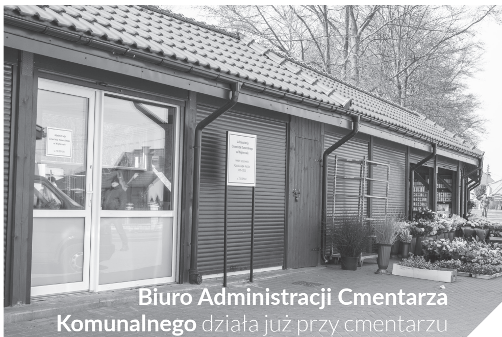
Biuro Administracji Cmentarza Komunalnego działa już przy cmentarzu

Wykaz wszystkich opłat i usług obowiązujących na Cmentarzu Komunalnym dostępny jest w Biurze Administracji Cmentarza Komunalnego. Opłat związanych z pochówkiem nie pobiera się za zmarłych w związku z wykonaniem pochówku na koszt opieki społecznej. W przypadku dochowania drugiej osoby do istniejącego grobu, pobiera się opłatę na kolejne 20 lat, którą pomniejsza się