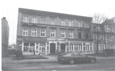
Budynek przy ul. Sobieskiego 318 przed remontem