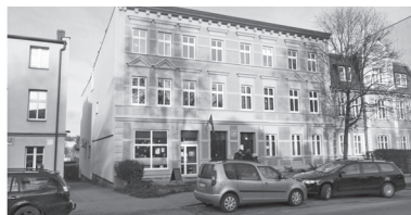
WM Sobieskiego 318