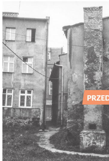
Ul. 12 Marca 222- 224 ▶