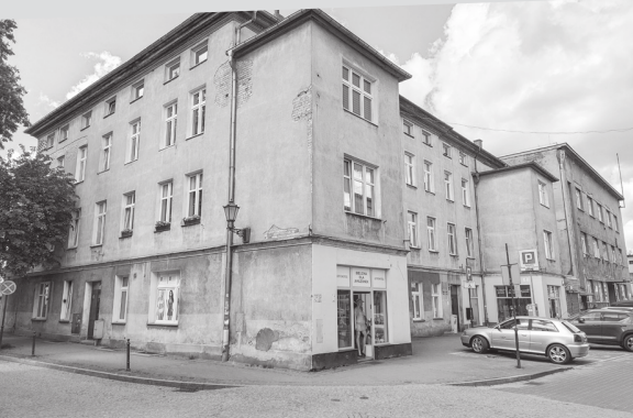
ul. Pucka 9

Zadanie jest współfinansowane ze środków Europejskiego Funduszu Rozwoju Regionalnego w ramach Regionalnego Programu Operacyjnego Województwa Pomorskiego na lata 2014-2020 w ramach projektu „Rewitalizacja Śródmieścia Wejherowa”.