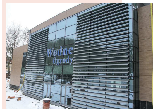
▼ W TRAKCIE