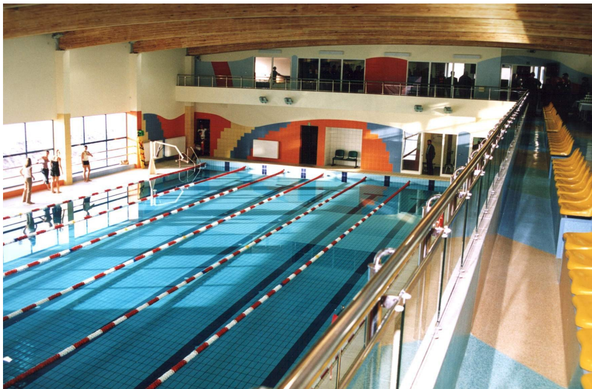
Kryta pływalnia przy Zespole Szkół nr 3