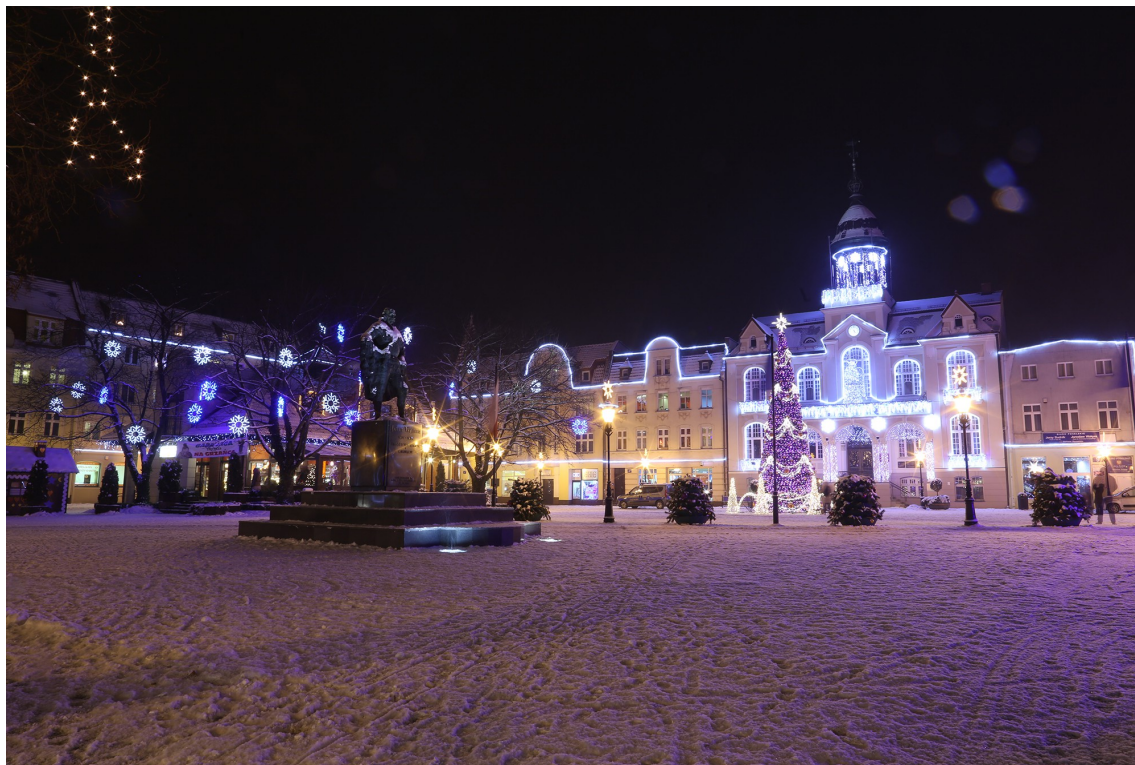
Rynek z ratuszem w świątecznej iluminacji