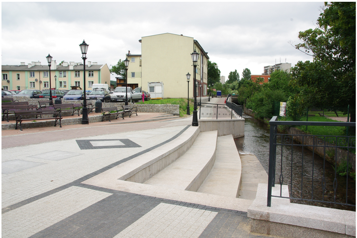
Promenada wzdłuż rzeki Cedron