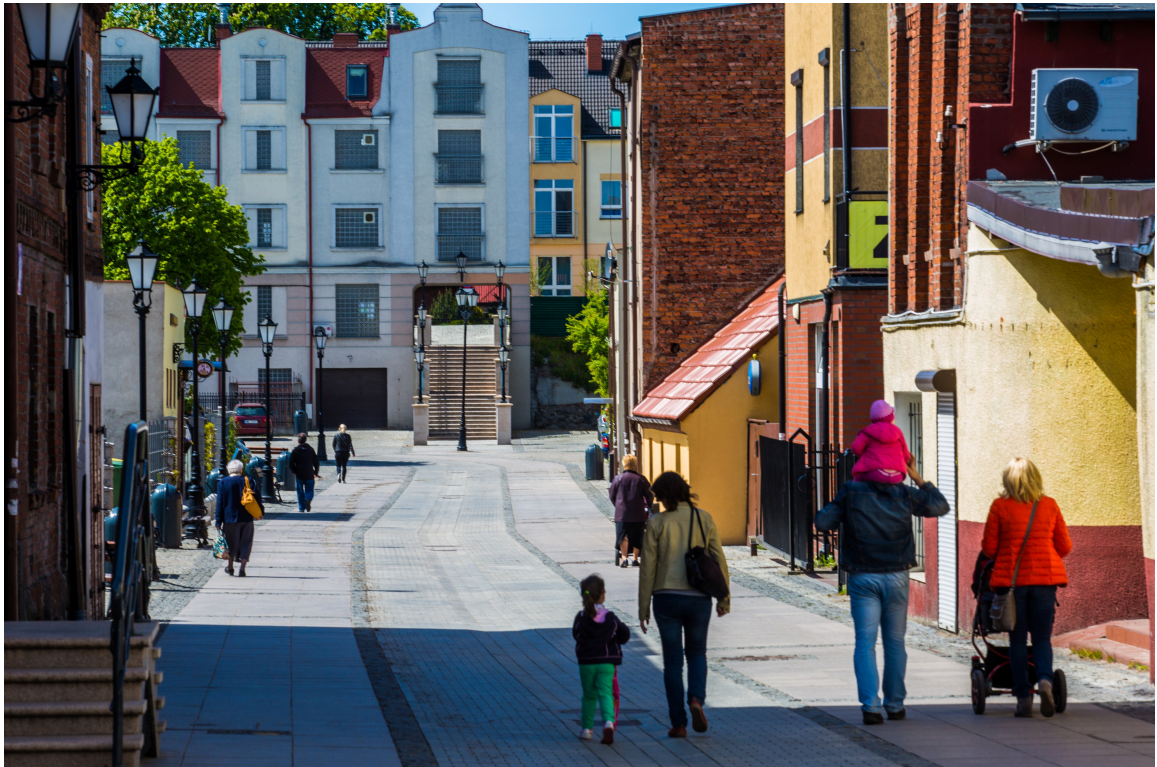
ul. Wałowa po modernizacji