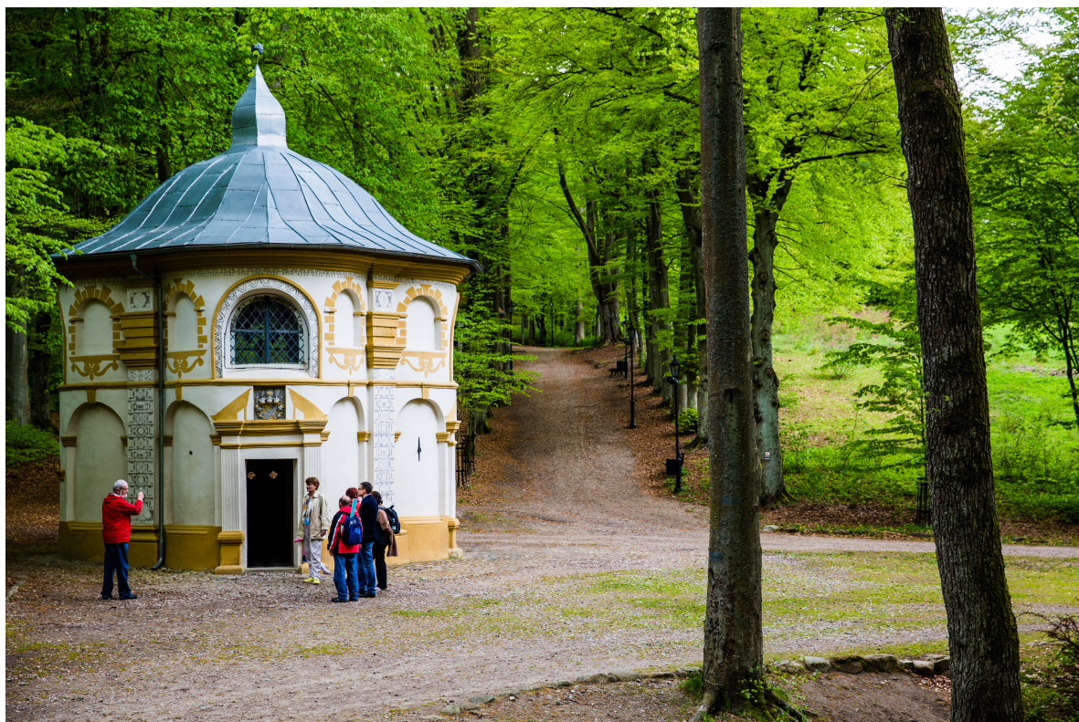
Kalwaria Wejherowska – Kaplica Spotkania z Matką